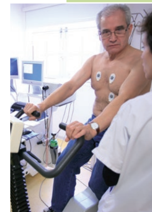
L'examen dure 9 à 15 minutes.