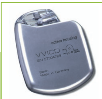
Un stimulateur cardiaque

La durée de vie d'un stimulateur varie selon la capacité de la pile, la fréquence des stimulations et de la consommation de courant. Un programmeur externe permet son contrôle et sa programmation. En moyenne leur durée de vie est de 10 ans, mais demandez à votre médecin.