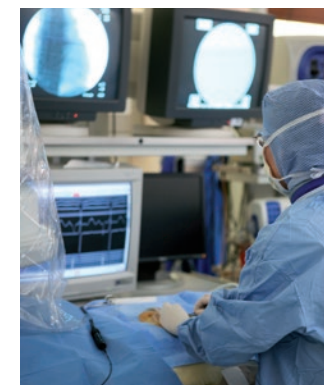
Ablation par radio fréquence.

Vous pouvez recevoir gratuitement la carte de l'urgence cardiaque soit en la téléchargeant ou en la commandant sur le site www.fedecardio.org/brochures