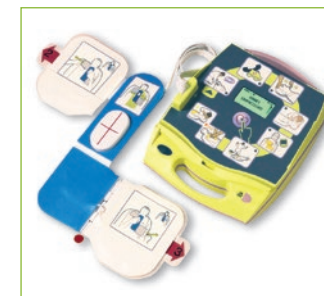
Défibrillateur semi-automatique (DSA).